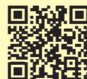
Text und Layout: Thomas Steinecke